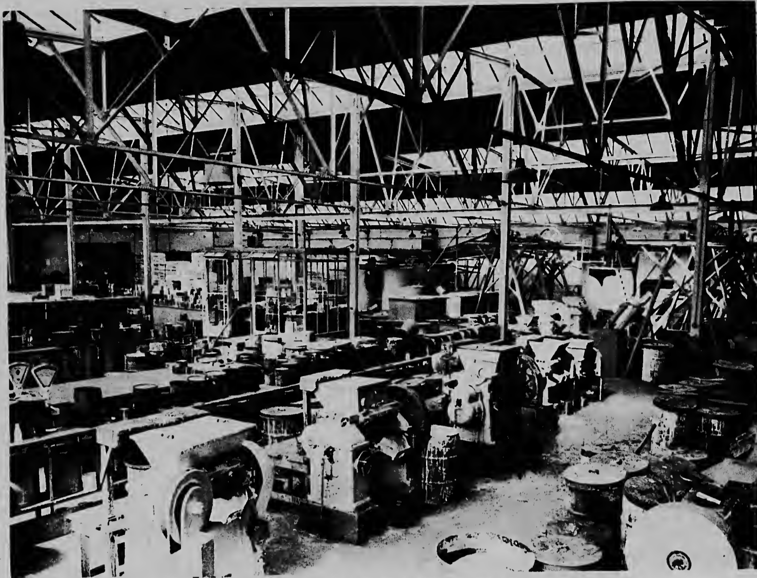
Un parti di un di e halnan di e fabrica na Overschie, na unda verf ta ser trahá cu e machiennan mas moderno.

s y direccion di e fabrica ta a satisfecho cu loke e tra- nan Antillano ta presta, Se- Groen ta mira posibilidnan erto industríanan pa ser es- cá na Antillas y pa dirigi nan tacion riba Suramerica. E ra gran posibilidnan pa fu-